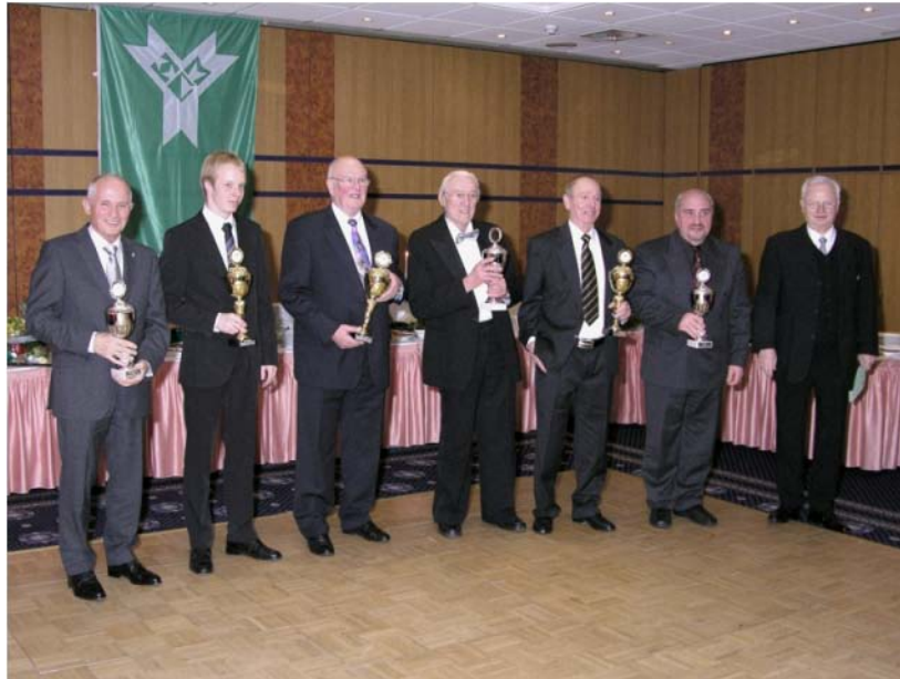
Die erfolgreichen Speedmodellauto Fahrer