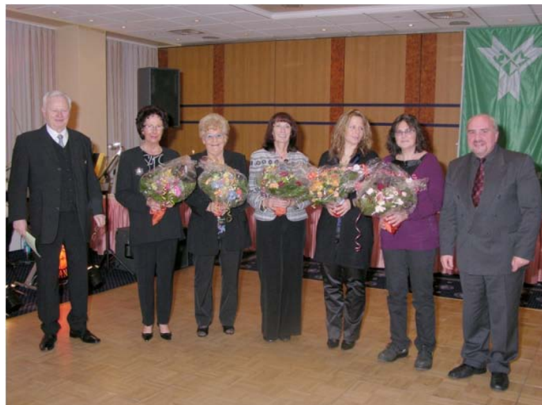
Dank an unsere Damen