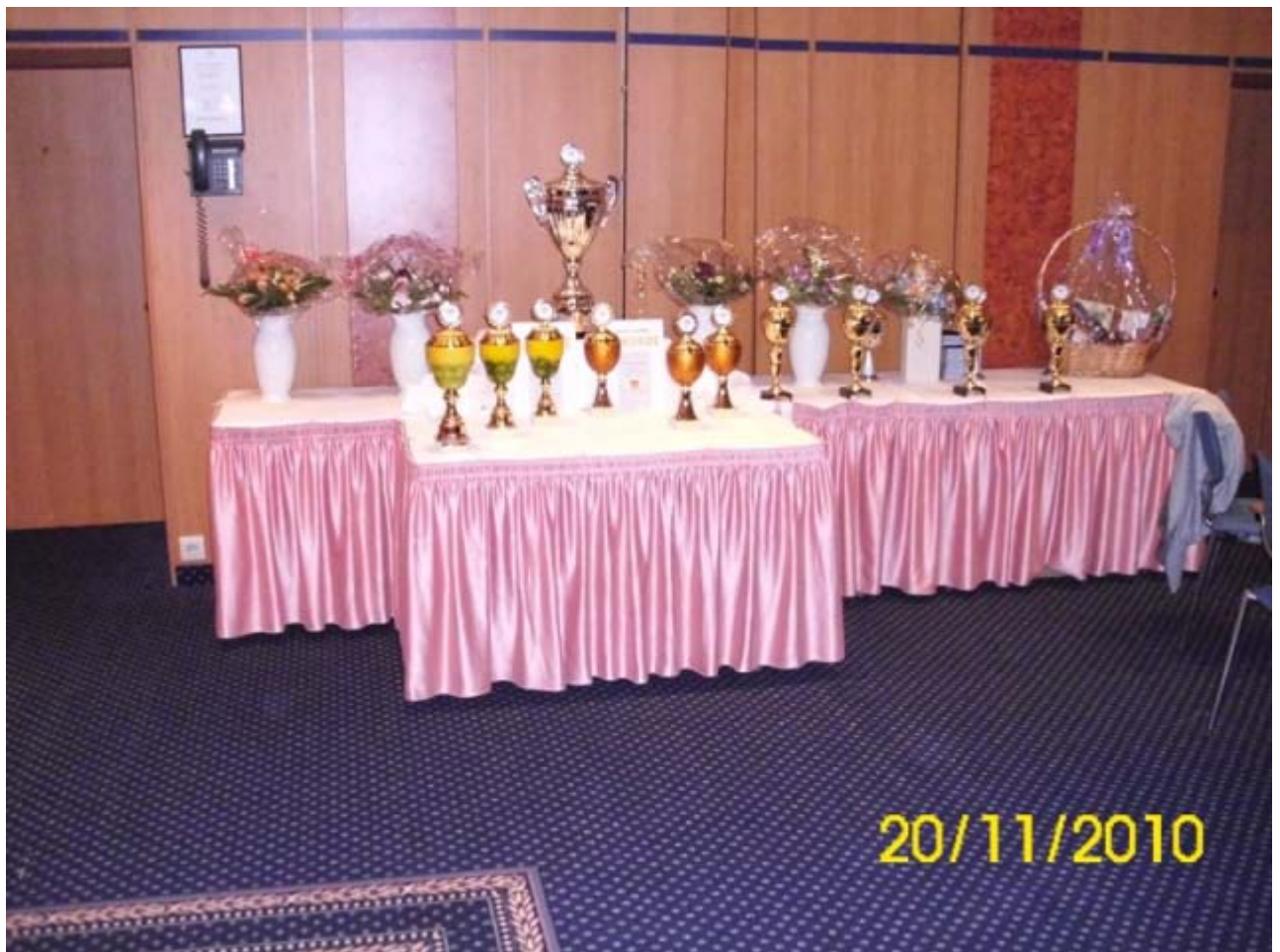
Der HMC Gabentisch