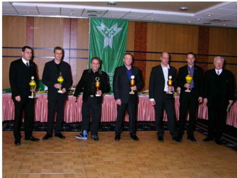
Die erfolgreichen Motorradfahrer